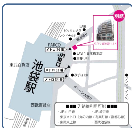
池袋会場 (アットビジネスセンター池袋別館)

◇説明会会場地図 ※必ずご予約の上ご参加下さい。当日会場での参加申込はお受付できません。