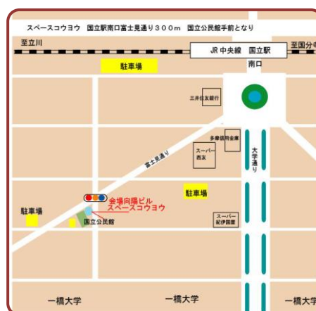
国立会場 (スペースコウヨウ)

※池袋駅(東口)を出て「LABI1日本総本店」の左隣。 1~3階「ZARA」店舗・地下1階椿屋珈琲店が目印。