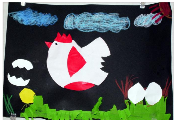
年長児クラスによる作品