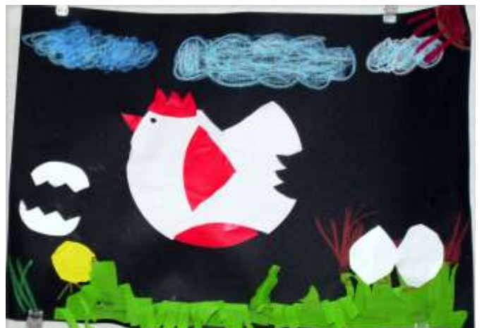
年長児クラスによる作品