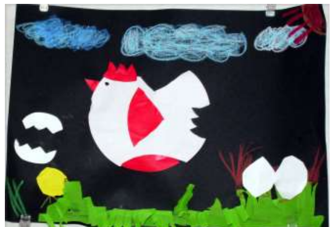
年長児クラスによる作品