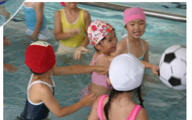
なかなか手ごわい、水中動物歩きに後ろ歩き。水の中だからできる宇宙遊泳ごっこ。お友達との協力がかかせないビーチボールキャッチ。プールって本当に楽しい！子どもたちのはじけるような笑顔が印象的でした。