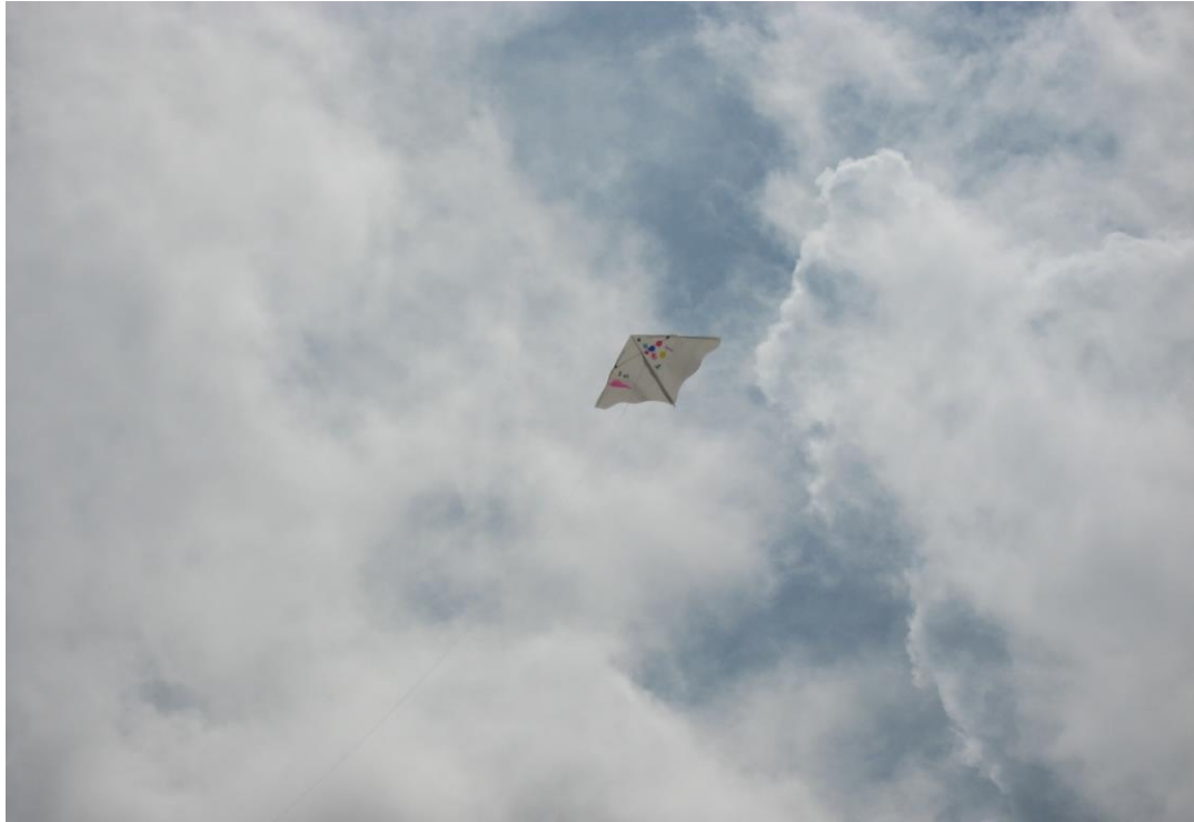
天高く舞い上がるタコ。羽には子どもたちが思い思いに描いた絵をのせて「ぼくのタコが宇宙一高くあがってるー！」笑い声と歓声がこだまします。